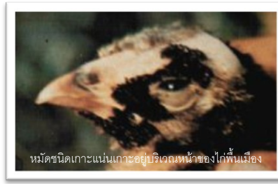
หมัดชนิดเกาะแน่นเกาะอยู่บริเวณหน้าของไก่พื้นเมือง