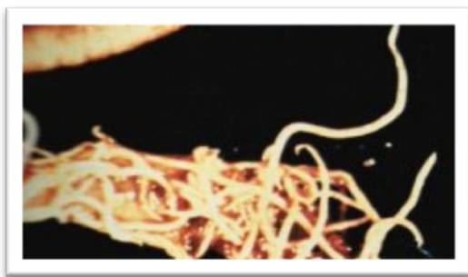
พยาธิไส้เดือนในลำไส้เล็กของไก่พื้นเมือง

ใช้ยาถ่ายพยาธิให้ผลดีที่สุด คือ บีปเปอร์ราซิน โดยผสมน้ำดื่มในขนาด 500 มิลลิกรัมต่อไก่ใหญ่ การให้ยาถ่ายพยาธิควรให้เมื่อไก่มีอายุ 6,16 และ 26 สัปดาห์