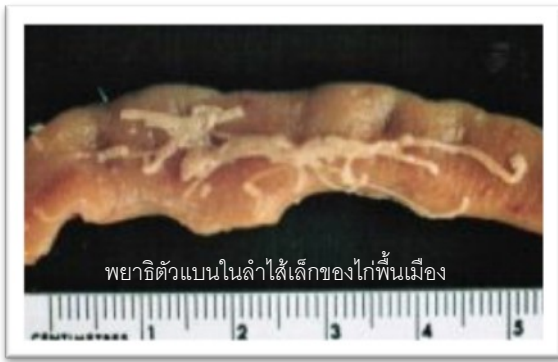
พยาธิตัวแบนในลำไส้เล็กของไก่พื้นเมือง